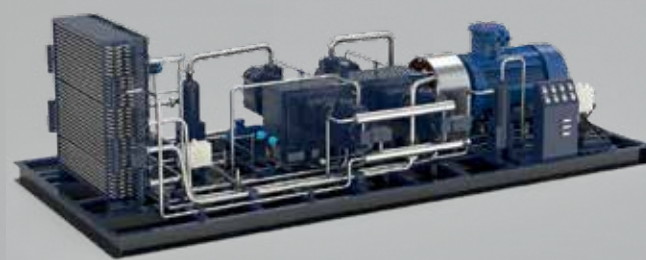
КОМПРЕССОР ДЛЯ РАЗЛИВА

КОМПРЕССОРЫ СПЕЦИАЛЬНОГО ИСПОЛНЕНИЯ ПОД ПАРАМЕТРЫ ЗАКАЗЧИКА