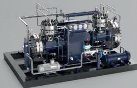
ГАЗОНАПОЛНИТЕЛЬНАЯ КОМПРЕССОРНАЯ ПОДСТАНЦИЯ