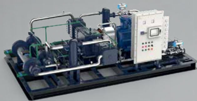
КОМПРЕССОР ДЛЯ ПРИРОДНОГО ГАЗА

ПОЛНОСТЬЮ АВТОМАТИЧЕСКОЕ ИНТЕЛЛЕКТУАЛЬНОЕ УПРАВЛЕНИЕ ВОЗМОЖНОСТЬ РАБОТЫ БЕЗ ОПЕРАТОРА